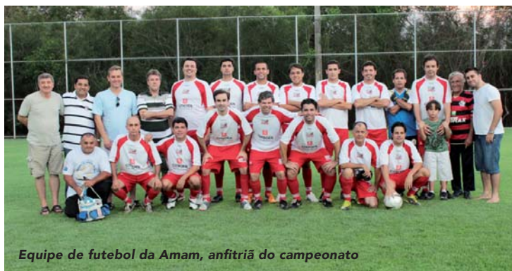
Equipe de futebol da Amam, anfitriã do campeonato